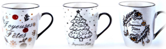
Mugs assortis « Joyeuses Fêtes » Diam. 8,5 cm, h. 10,5 cm