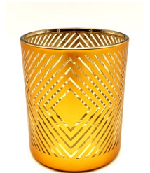
Photophore « Losange », en verre, décor doré, garni d'un sachet de 250 g de chocolats assortis. Diam. 8,5 cm, h. 10 cm