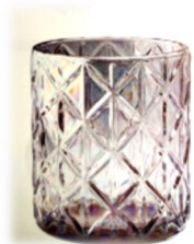
« Mauve », en verre dépoli, garni d'un sachet de 350 g de chocolats assortis Diam. 8,5 cm, h. 10 cm