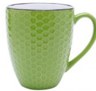
Mug vert Diam. 9,5 cm h. 11,5 cm