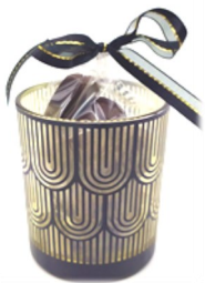
Photophore en verre, décor noir, intérieur doré, garni d'un sachet de 250 g de chocolats assortis. Diam. 9 cm, h. 10 cm