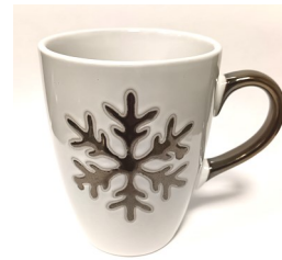
Mug « Flocon » Diam. 8 cm h. 10,5 cm