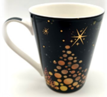
Mug « Sapin », noir décor doré Diam. 9,5 cm, h. 11 cm

Mugs contenant un sachet de 200 g de chocolats assortis Préciser le modèle sur le bon de commande